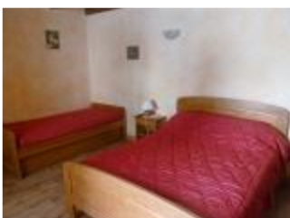
Toutes les chambres sont en rez de chaussée