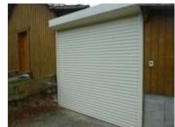
Grand garage fermé, sécurisé.