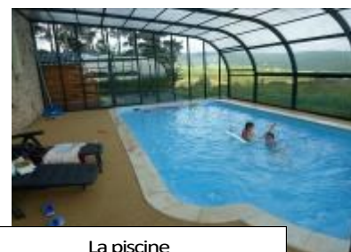
La piscine de début juin à fin septembre

Gîte de groupe Les Volpilières à Trailus - 15320 Ruynes en Margeride