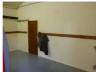
Local de séchage vêtements.